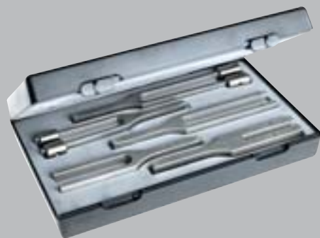
Nr. 5141 Набор II 5 камертонов, изготовленных из стали (Nr. 5161, 5164, Nr. 5166, Nr. 5168, Nr. 5170) в пластиковом футляре.