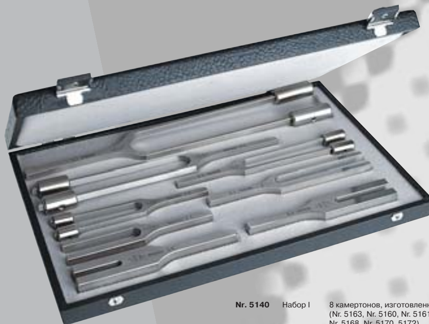
Nr. 5140 Набор I 8 камертонов, изготовленных из стали (Nr. 5163, Nr. 5160, Nr. 5161, 5164, Nr. 5166, Nr. 5168, Nr. 5170, 5172) в деревянном футляре.

Наборы камертонов - это хорошо продуманная комбинация в привлекательном деревянном или пластиковом футляре для проведения всех тестов слуха. Все наиболее важные приборы частоты всегда под рукой.