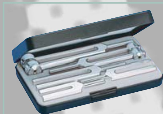
Nr. 5142 Набор III 5 камертонов, изготовленных из алюминия (Nr. 5162, Nr. 5165, Nr. 5167, 5169, Nr. 5171) в пластиковом футляре.

Дистрибьютор фирмы "Rudolf Riester GmbH & Co.KG"